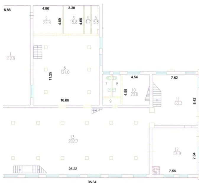
1-й этаж, Лихоборская, 11, стр. 25