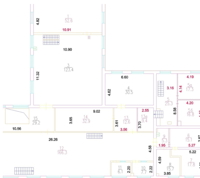
2-й этаж, Лихоборская, 11, стр. 25