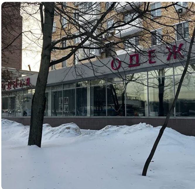
Проспект Мира, 131 1-й этаж