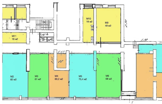
1-й этаж, Москва, Проспект Мира, 131