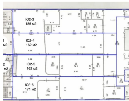
2 этаж Южнопортовая 9 Б